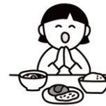
感謝の気持ちを育むマナー

給食の時間は、友達や先生と一緒に食べることで、協調性や社会性を育む大切な場です。「いただきます」「ごちそうさま」を通して、感謝の気持ちや食事のマナーを学びます。楽しい雰囲気の中で、食への興味を引き出し、自分で食べようとする意欲を伸ばします。