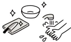
調理室での衛生管理