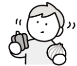
食べ物への興味・関心