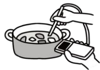
調理時の加熱の徹底(殺菌)