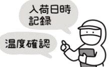
納入業者・食材の品質管理