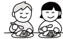
友達と一緒に食事を楽しむ